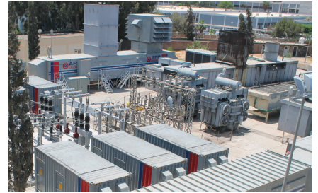
Al Furnag, Libya

Le système de production d'électricité et de transmission électrique libyen était incapable de subvenir à la demande pointue et croissante en électricité. APR Energy proposa des solutions rapides qui répondaient aux exigences clés de GECOL – former et utiliser les ressources techniques des clients locaux, et la production par turbines efficace et durable du point de vue de l'environnement. Notre capacité à fournir des turbines à gaz mobiles de pointe de manière accélérée nous a permis d'obtenir un contrat de 250 MW sur quatre sites situés dans des zones clés de la Libye.